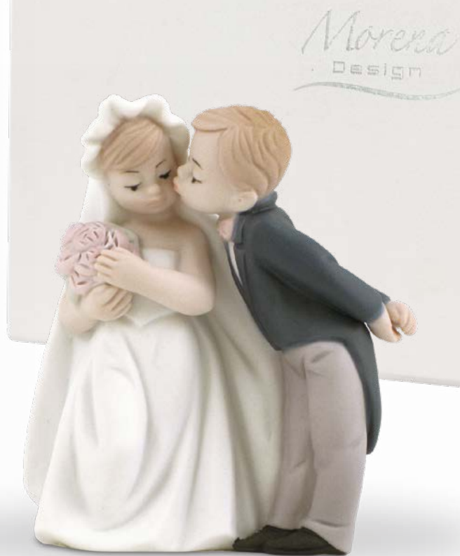
D7626 H cm 8 - Porcellana biscuit