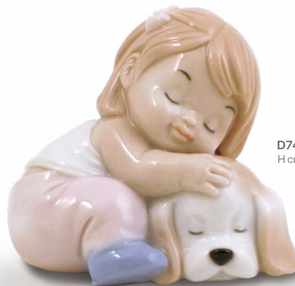
D7485 H cm 8