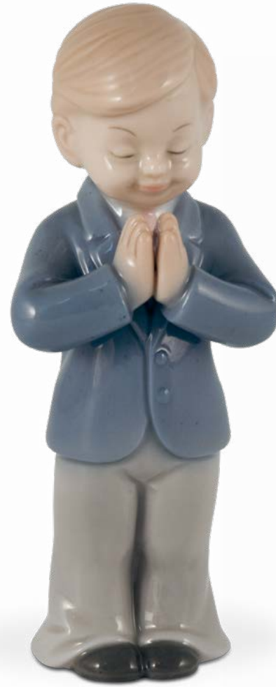
D7545 H cm 10,5