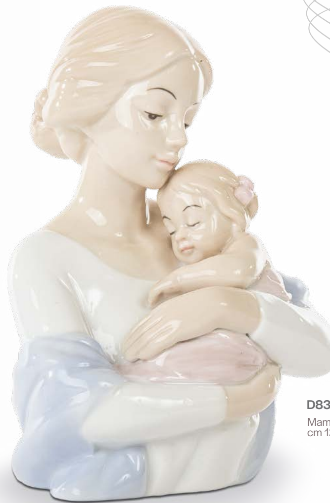
D8317 Mamma con bimba cm 12x8