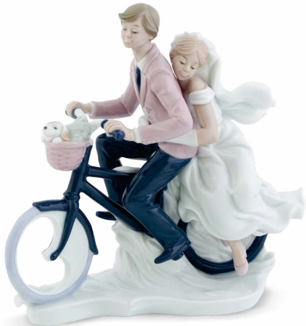
D7375 cm 21x19 H