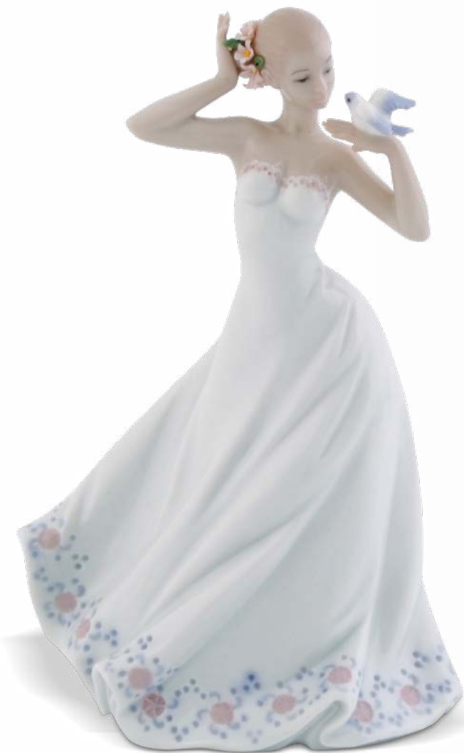
D7395 cm 17,5