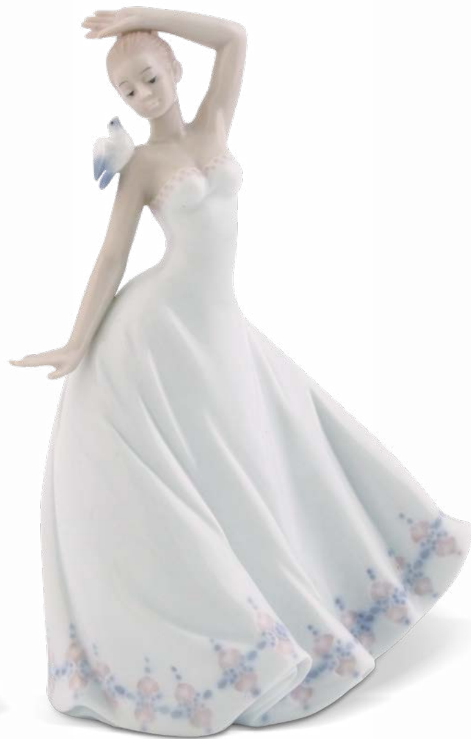
D7396 cm 17,5