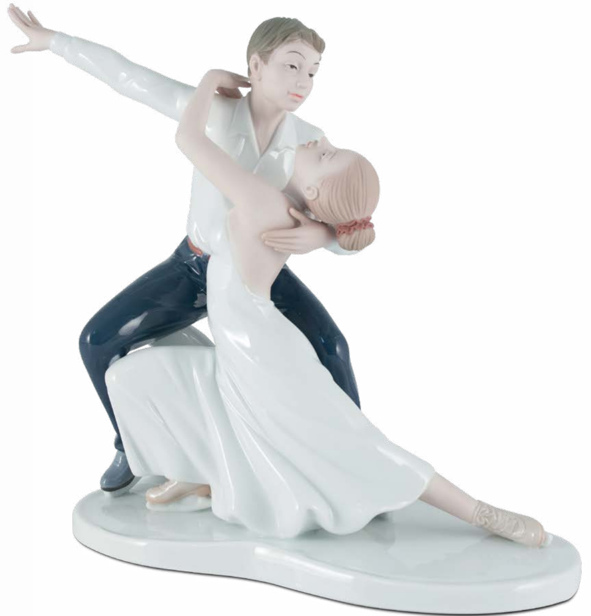
D7704 cm 28 - H cm 23,5