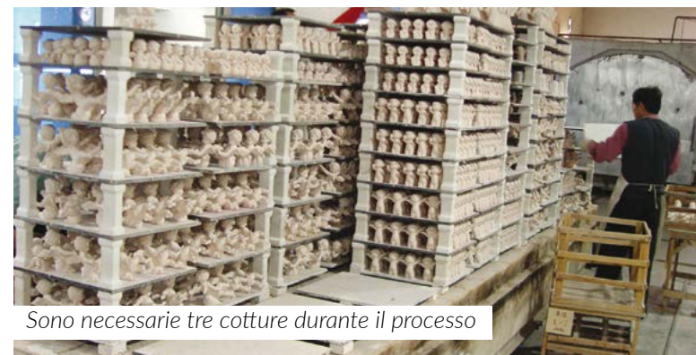
Sono necessarie tre cotture durante il processo