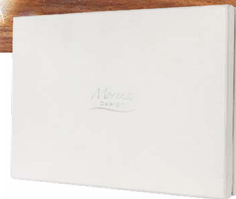
D8125 Alzata cristallo cm ø 30x16 H