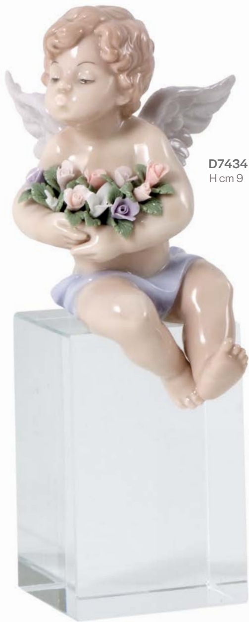
D7434 H cm 9