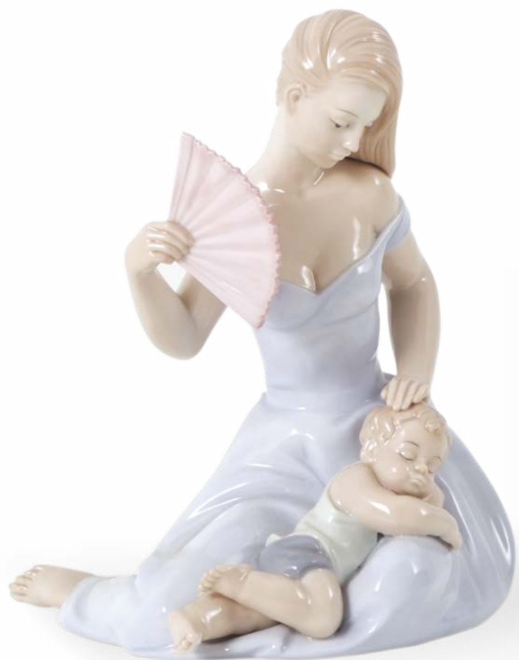
D7446 cm 13 x H cm 15