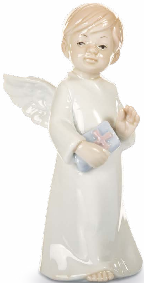
D7713 H cm 13