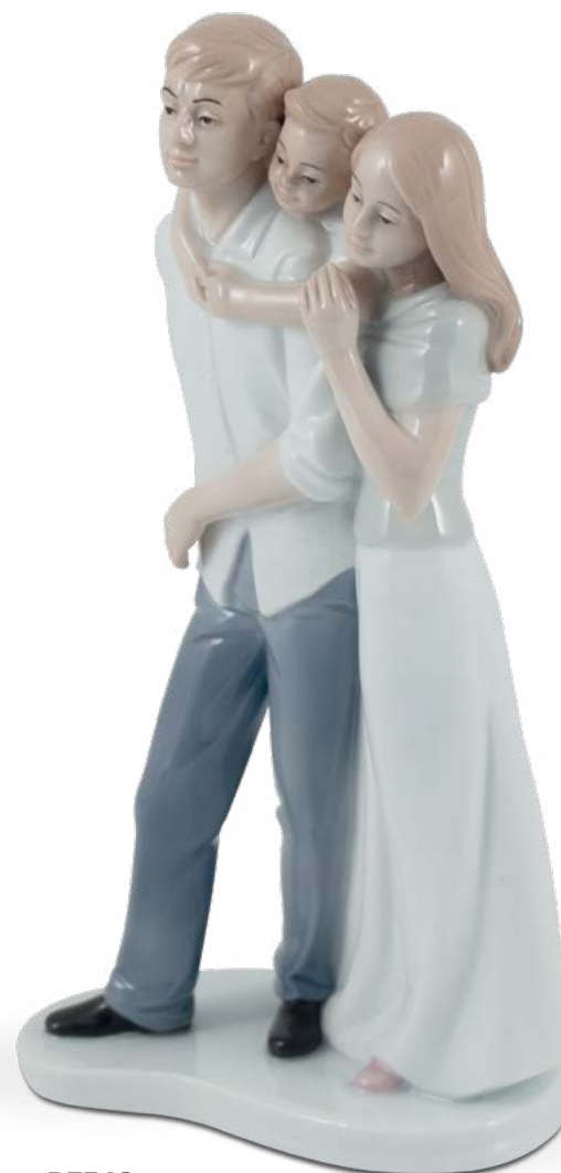
D7548 con Bimbo H cm 24