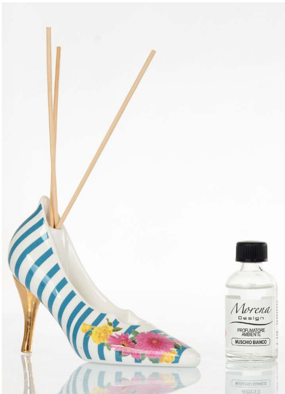
NOVITÀ Profumatori - cm 16x5,5x11 H