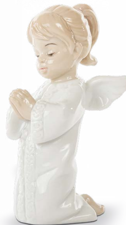
D8304 Angelo cm 10 H