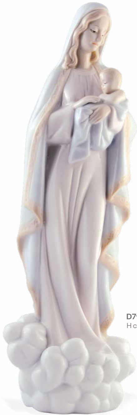
D7151 H cm 32