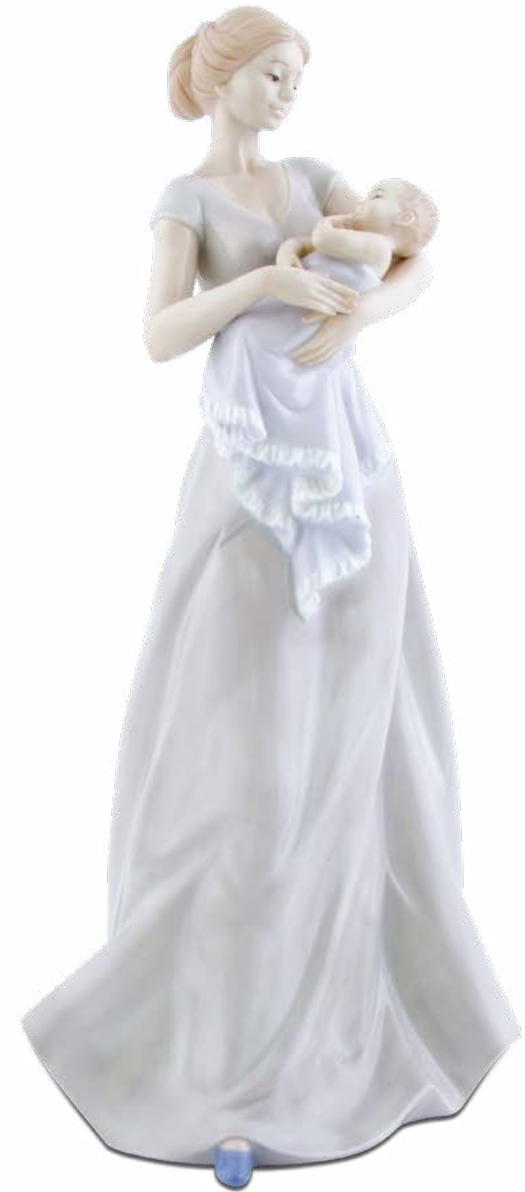
D7830 H cm 26