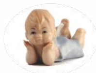
D7235 cm 7x9