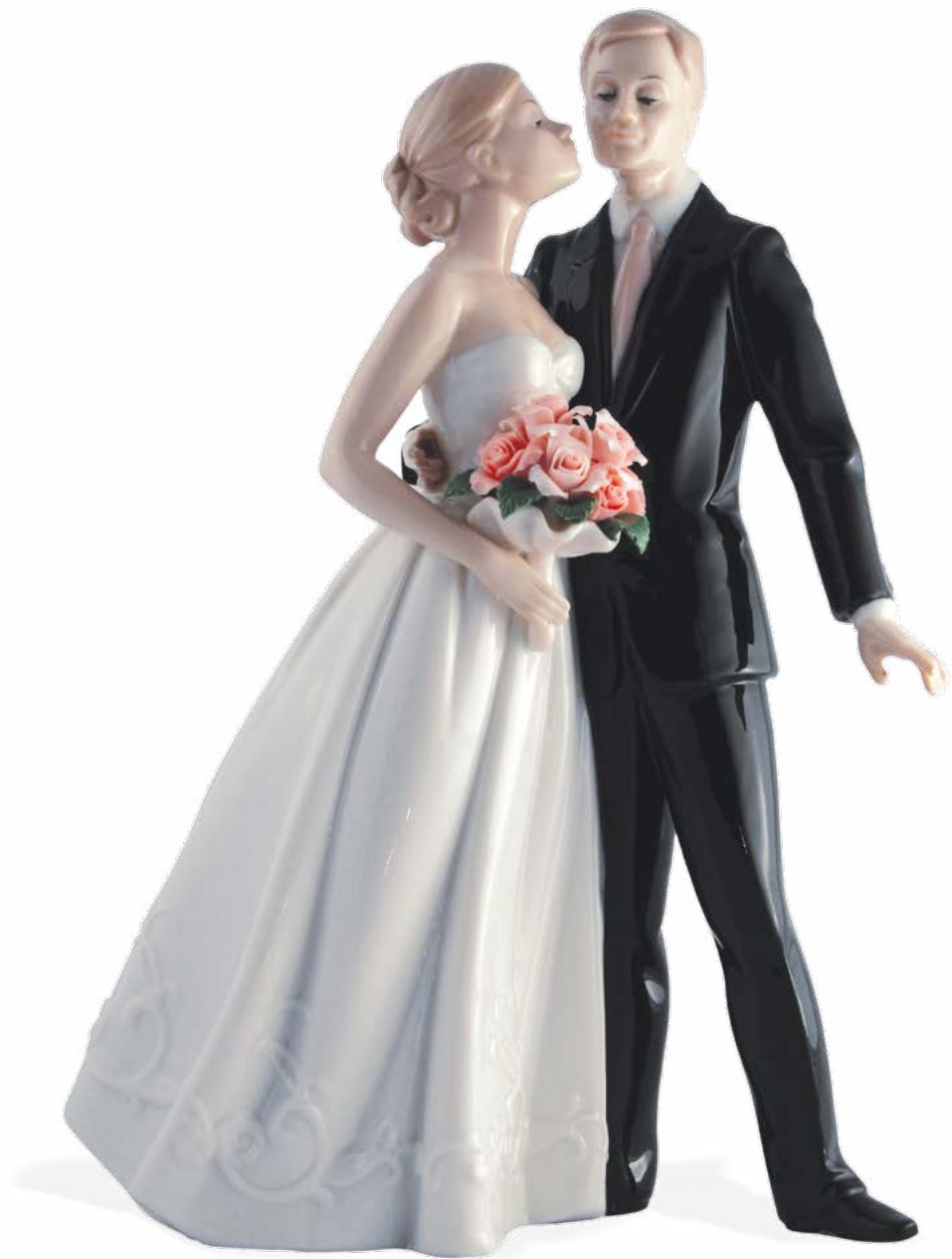
D7826 H cm 26