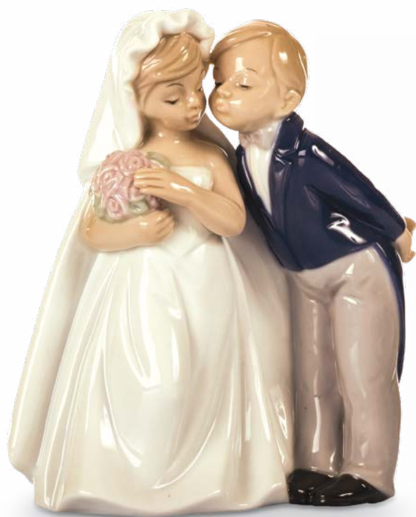
D7754 H cm 11