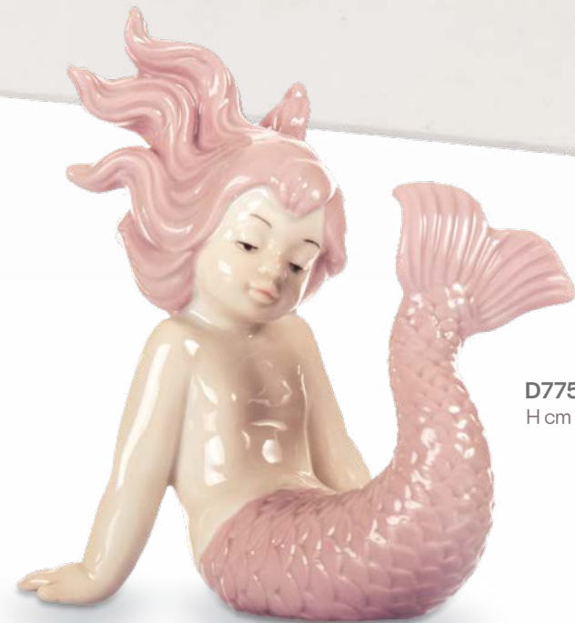
D7751 H cm 10