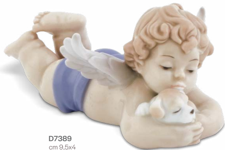
D7389 cm 9,5x4