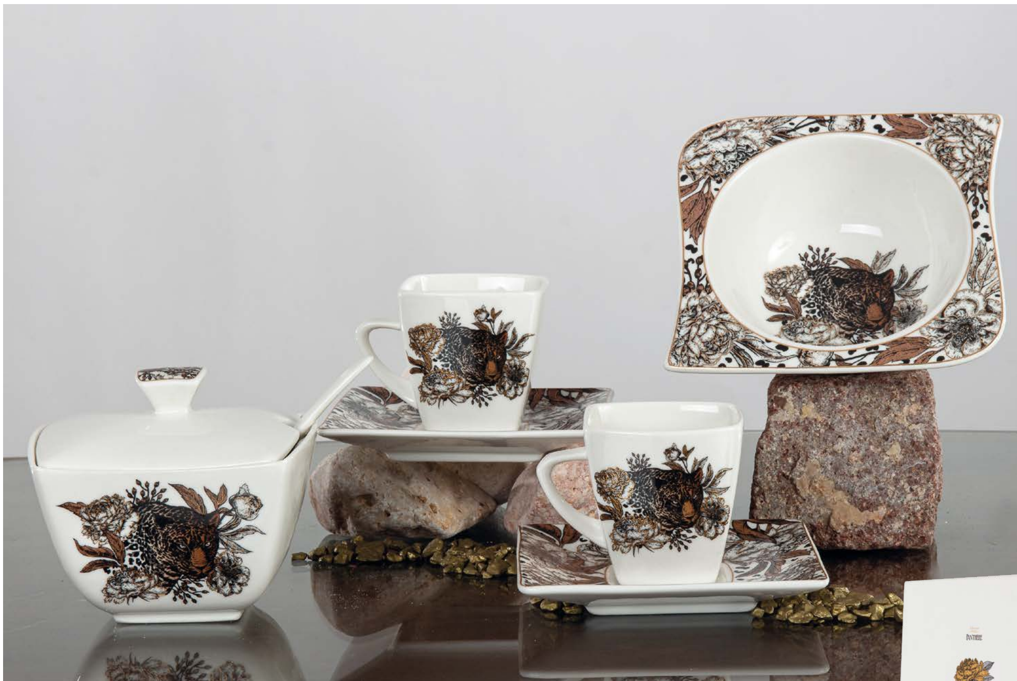
D8460 | NOVITÀ Zuccheriera cm 11x10x9 H