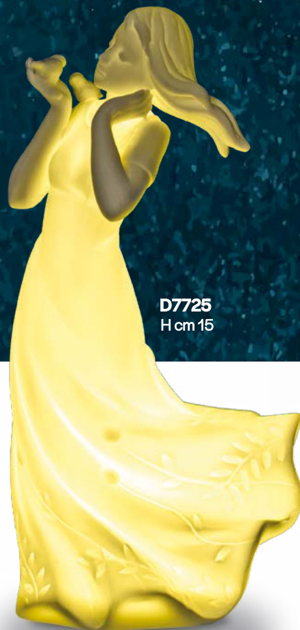
D7725 H cm 15