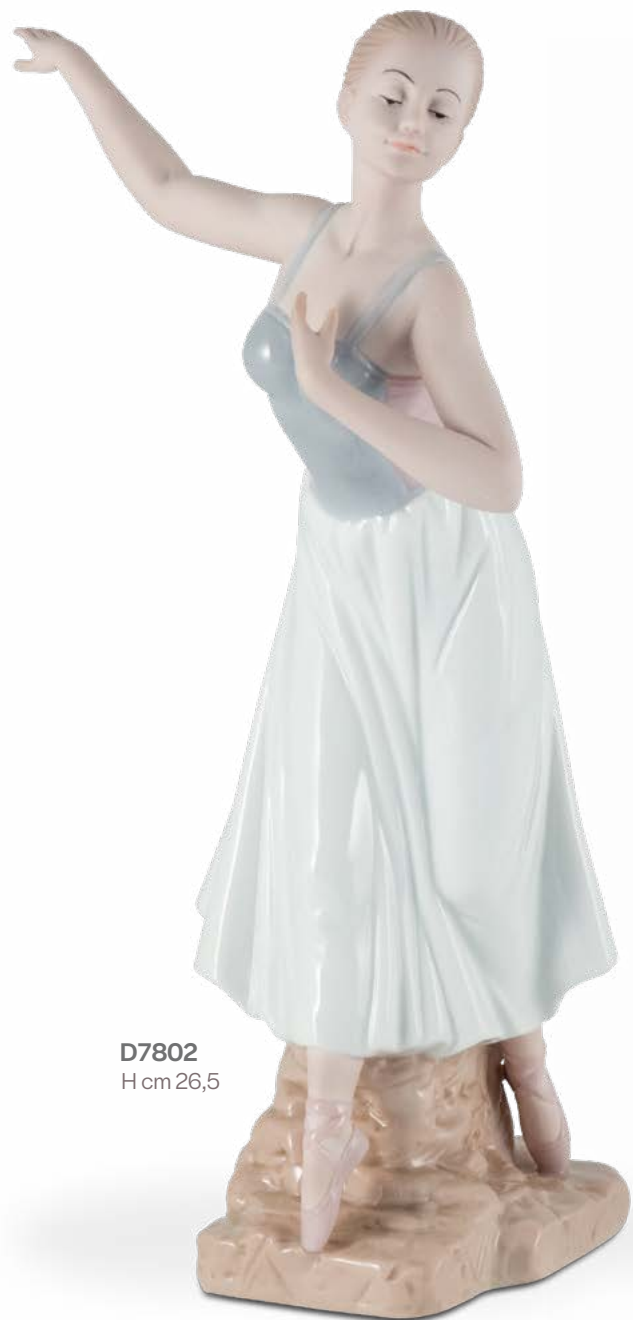
D7802 H cm 26,5