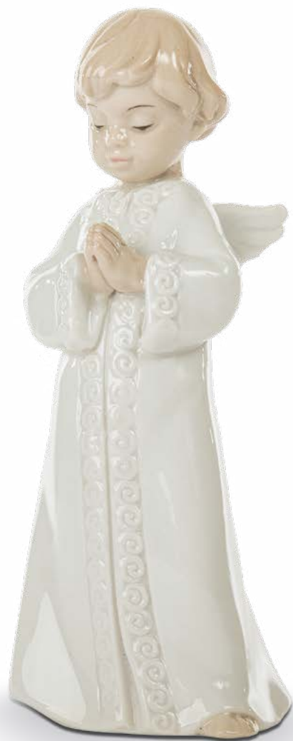
D8302 Angelo cm 14,5 H