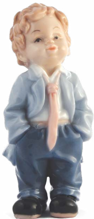
D7250 H cm 10