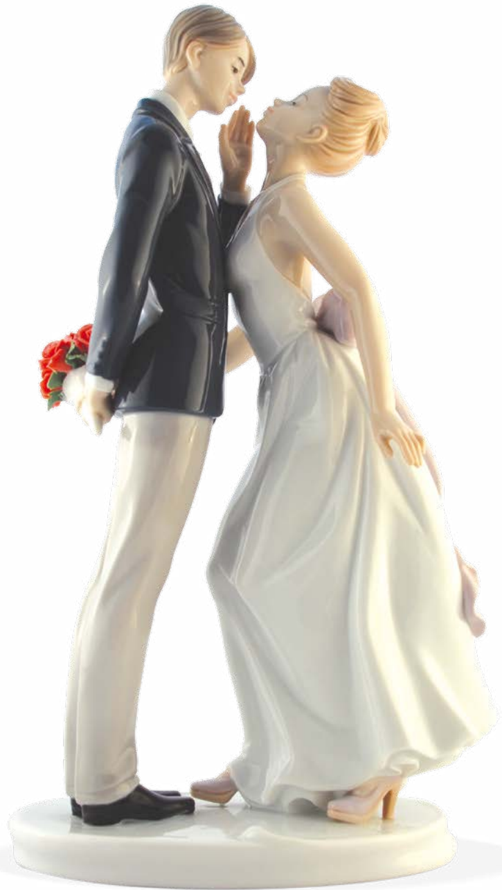
D7363 H cm 27