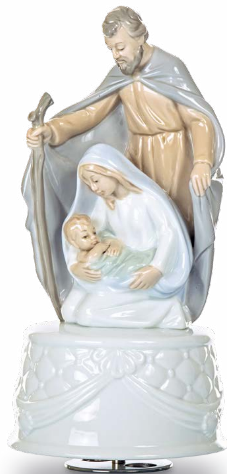
D7765 CARILLON H cm 21