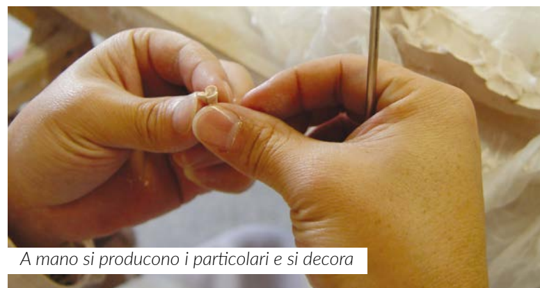
A mano si producono i particolari e si decora