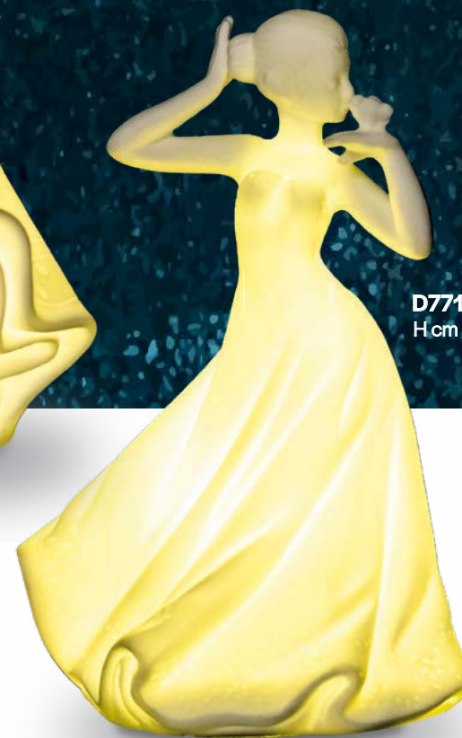
D7716 H cm 12