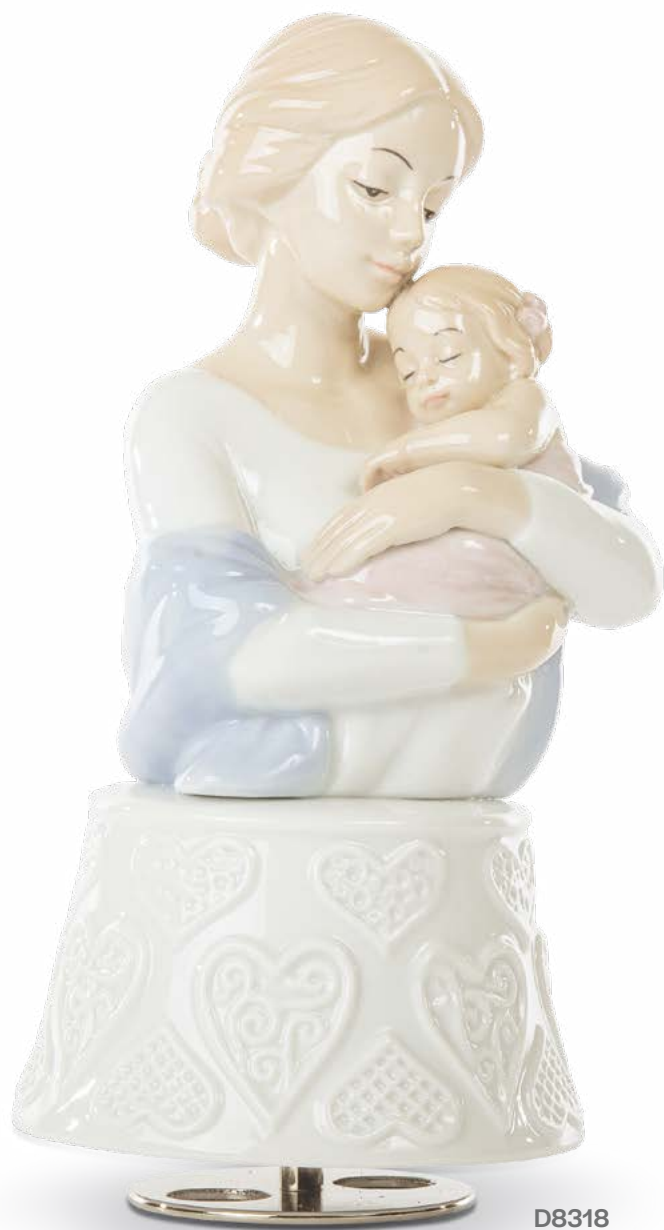
D8318 Carillon mamma con bimba cm 18 H