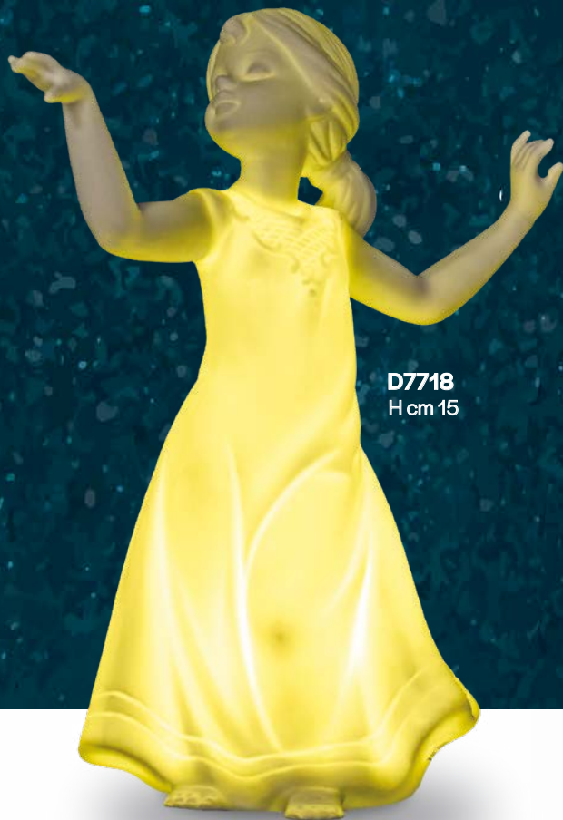
D7718 H cm 15