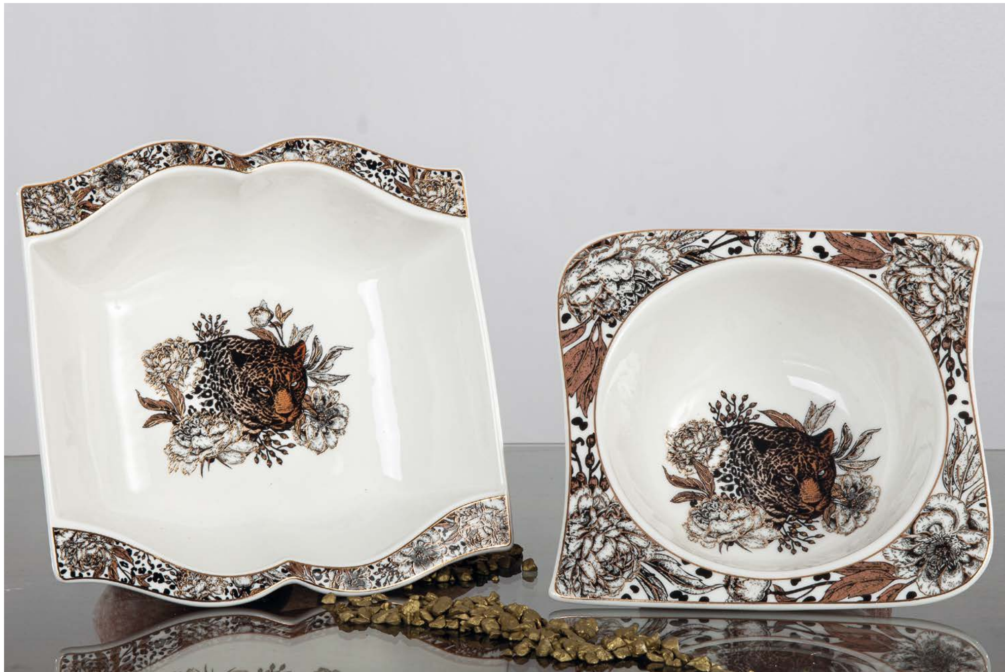
D8451 | NOVITÀ Centro cm 20x20x6 H