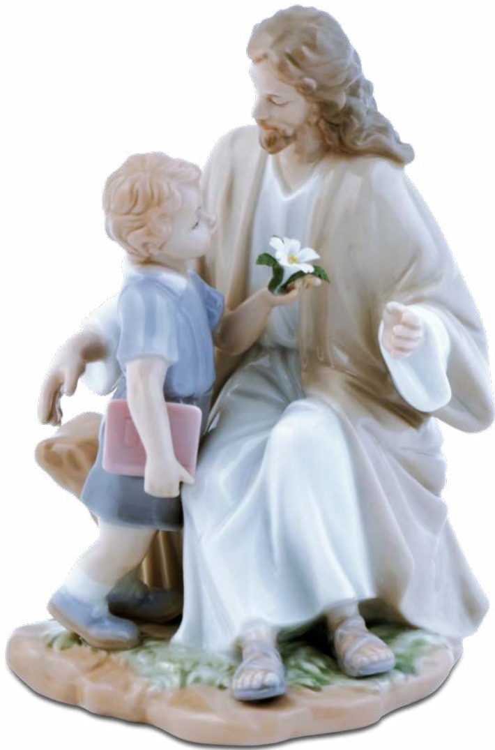
D7228 H cm 15