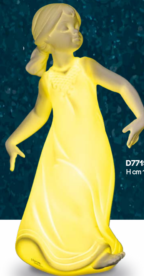
D7719 H cm 15