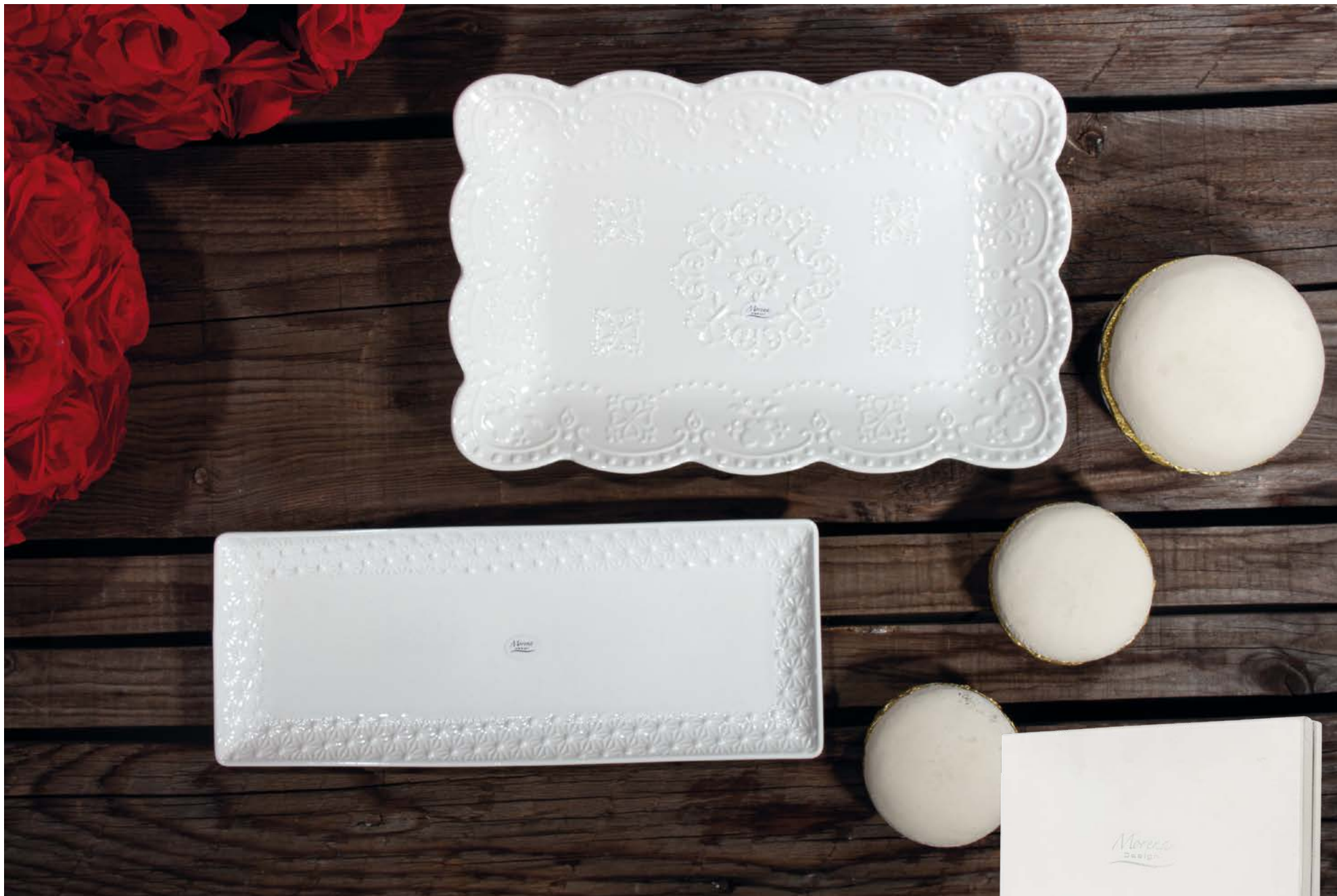
D8265 Vassoio cm 35x14