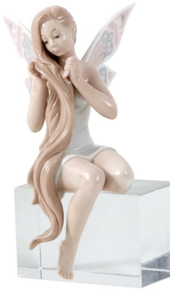
D7436 H cm 15 - Porcellana Base cristallo cm 5x5x8 inclusa