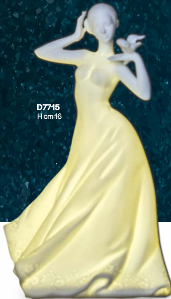
D7715 H cm 16