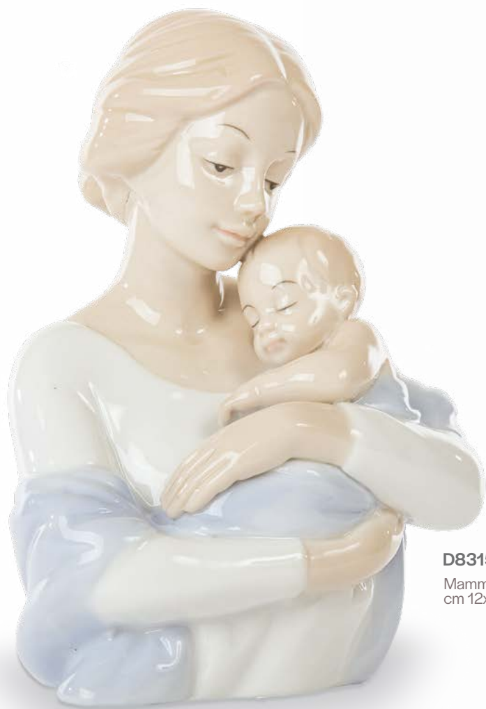
D8315 Mamma con bimbo cm 12x8