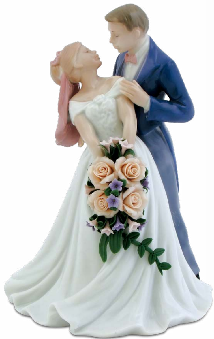
D7319 H cm 18