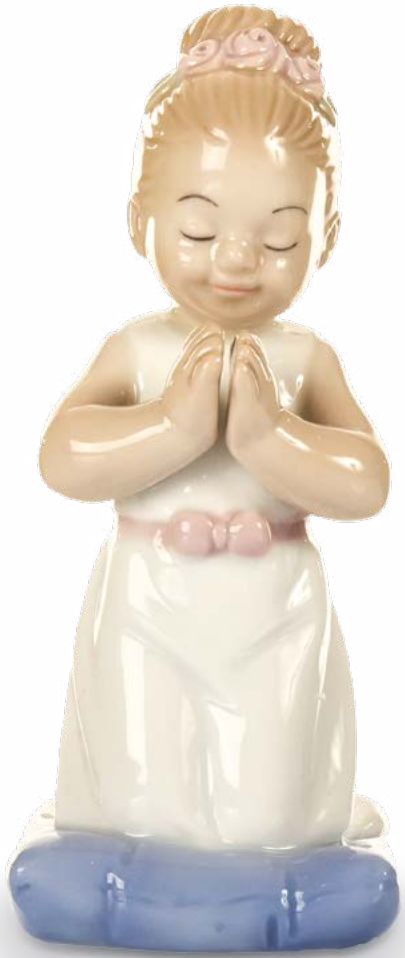
D7753 H cm 10