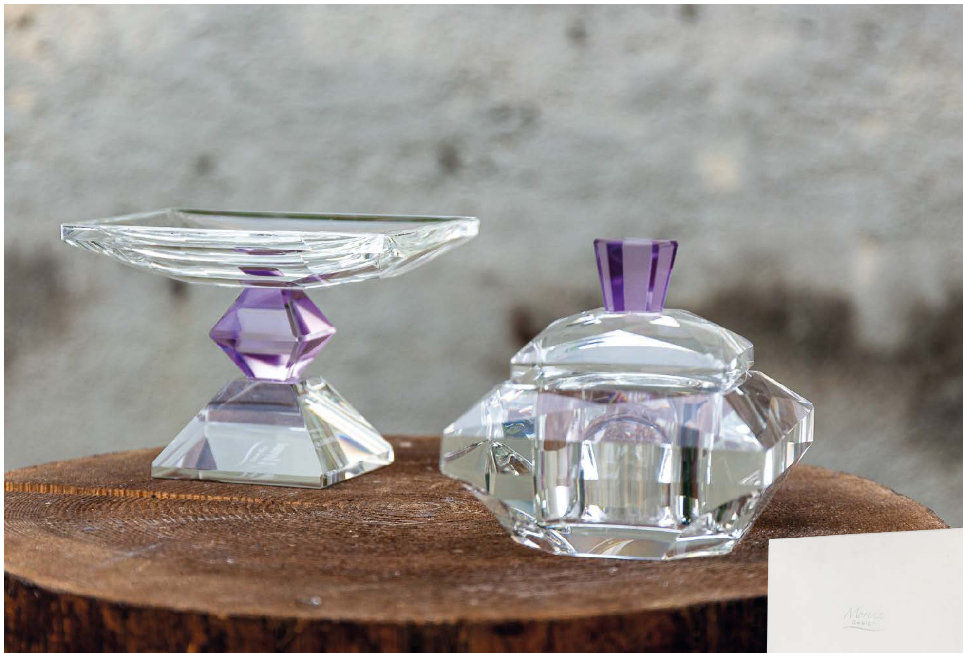
D8477 | NOVITÀ Alzatina cristallo cm 11x8x8 H