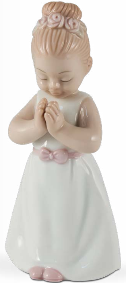
D7546 H cm 10,5