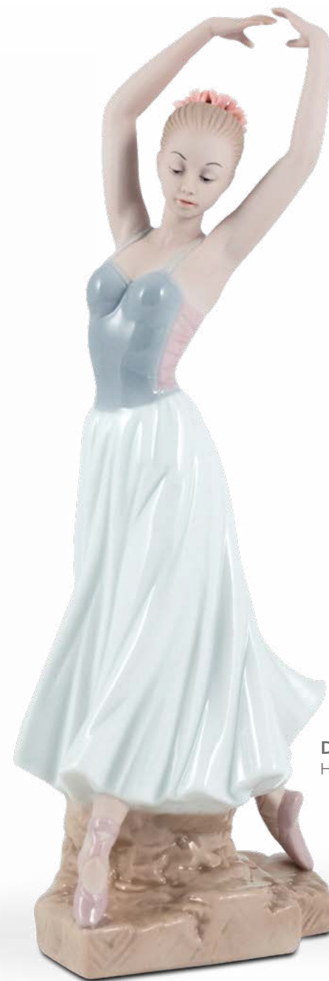
D7800 H cm 25