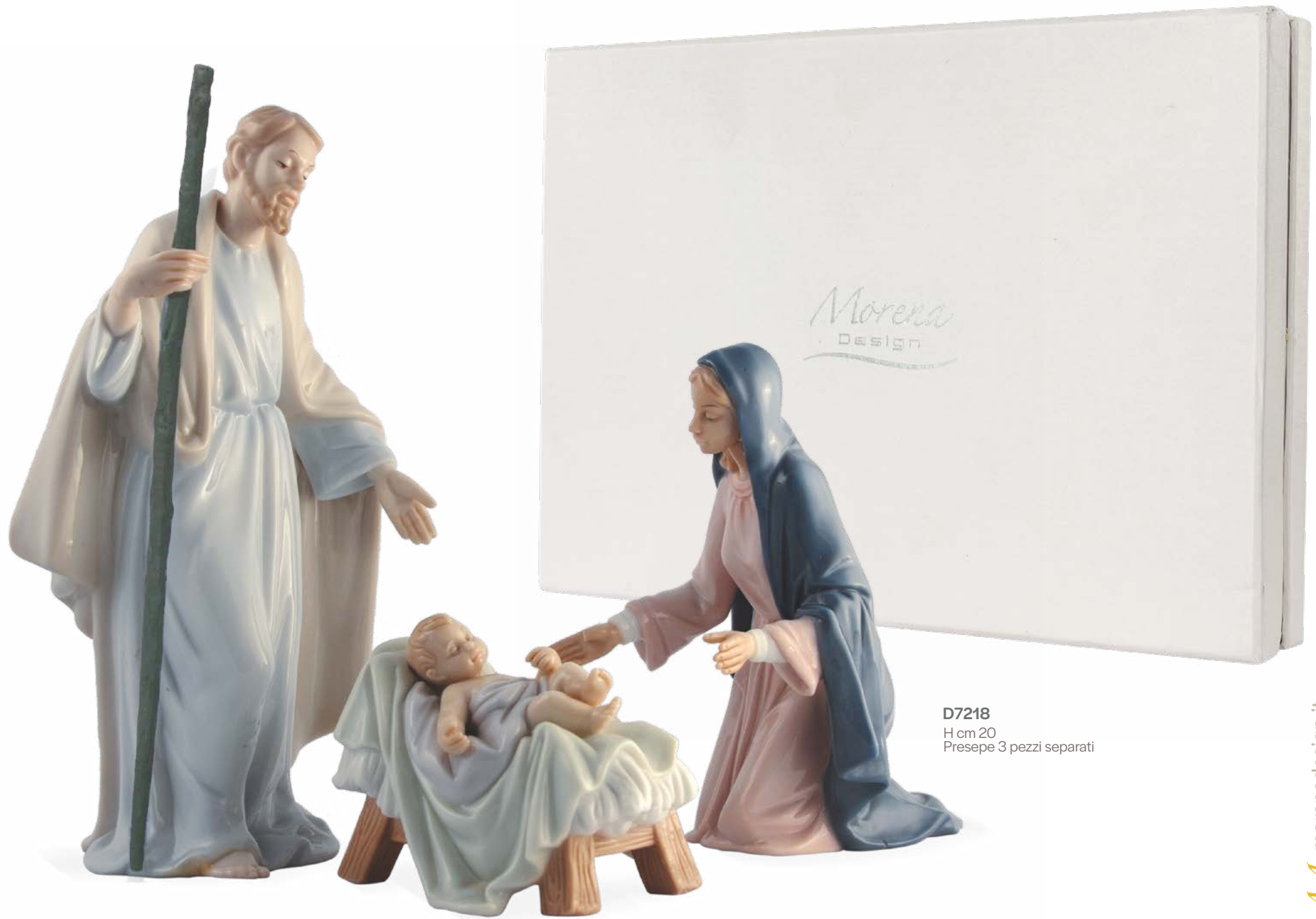
D7218 H cm 20 Presepe 3 pezzi separati