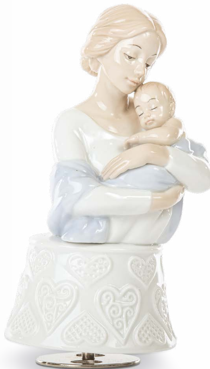
D8316 Carillon mamma con bimbo cm 18 H