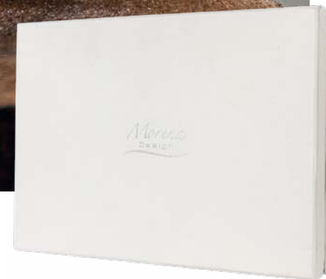
D8478 | NOVITÀ Scatola cristallo cm 9x9x8,5 H