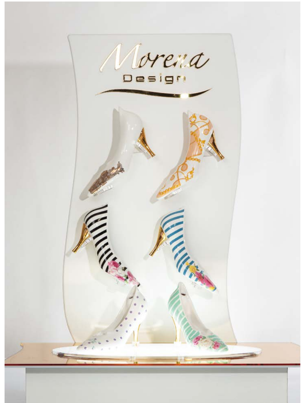
D8447 | NOVITA Espositore luminoso - cm 31x49x57 H