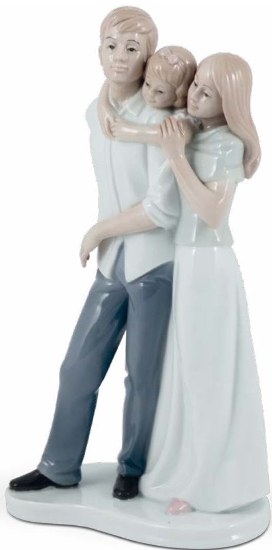
D7549 con Bimba H cm 24