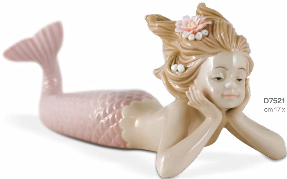
D7521 cm 17 x H cm 7