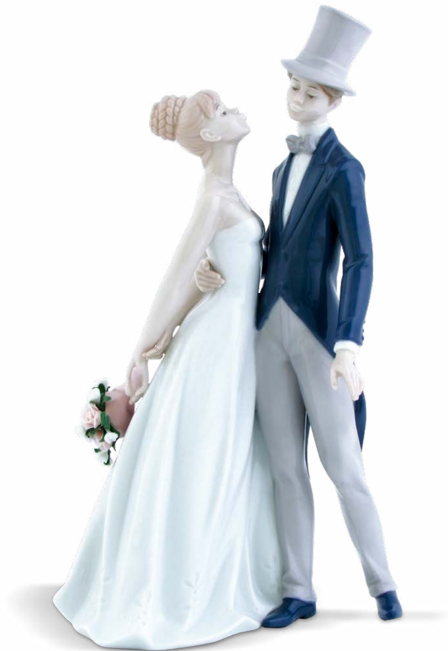
D7376 H cm 29