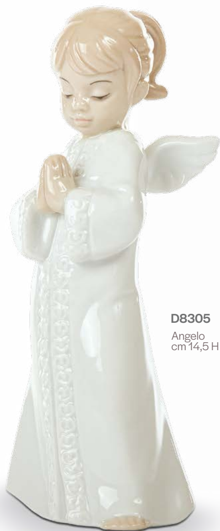
D8305 Angelo cm 14,5 H