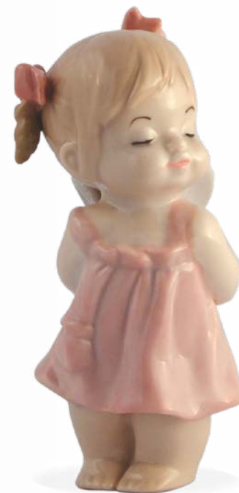
D7237 H cm 9