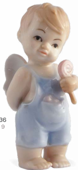
D7236 H cm 9