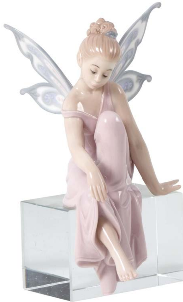
D7435 H cm 15 - Porcellana Base cristallo cm 5x5x8 inclusa