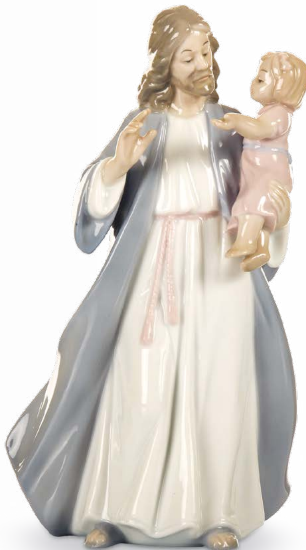
D7743 H cm 15