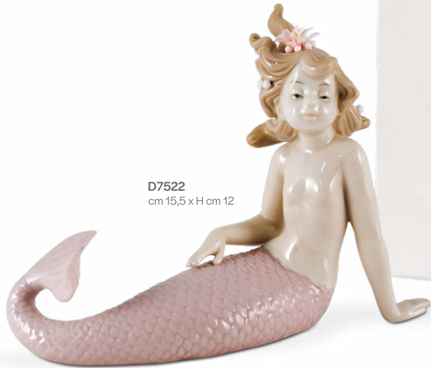
D7522 cm 15,5 x H cm 12