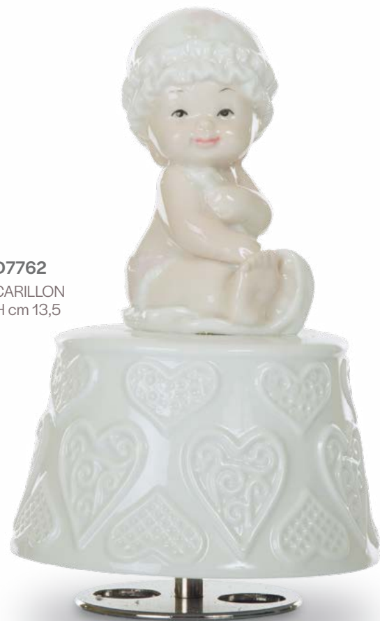
D7762 CARILLON H cm 13,5