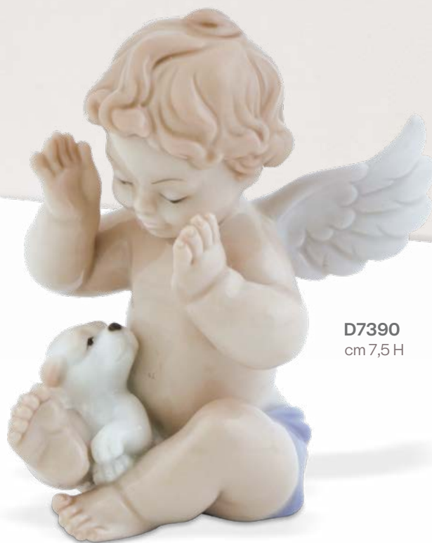
D7390 cm 7,5H