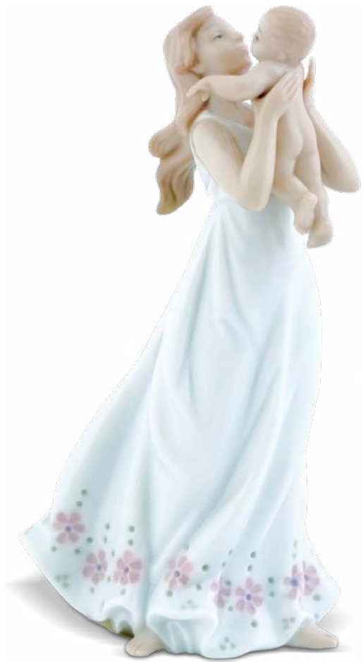
D7244 H cm 18