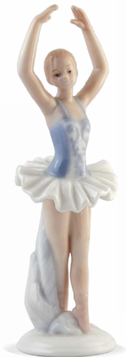
D7134 H cm 16