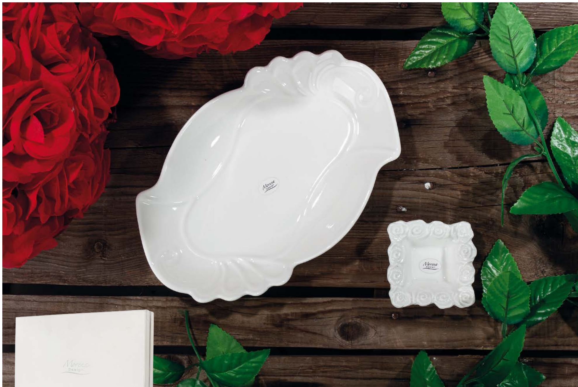
D8234 Raviera cm 27x18