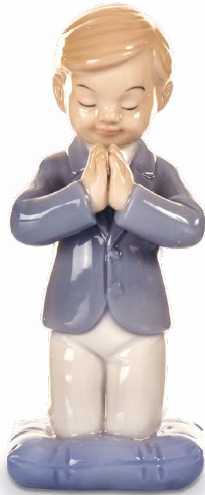
D7752 H cm 10