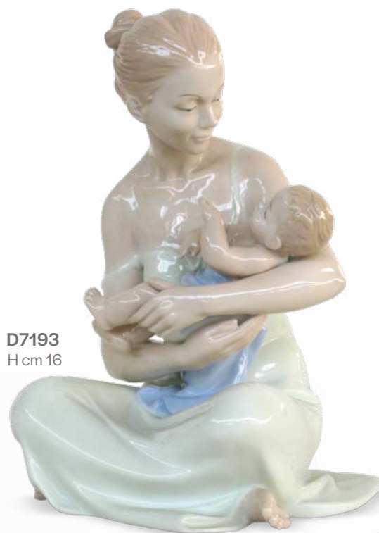
D7193 H cm 16