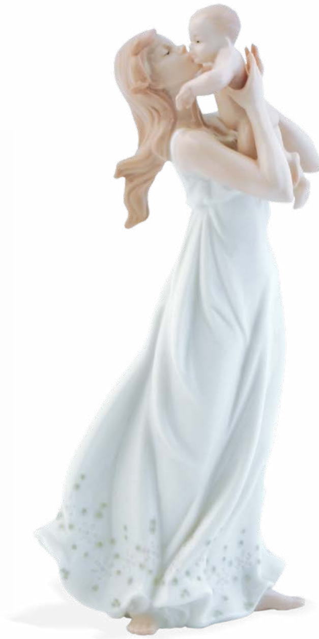
D7245 H cm 28