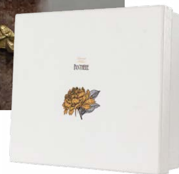
D8458 | NOVITÀ Ciotola cm 14x13