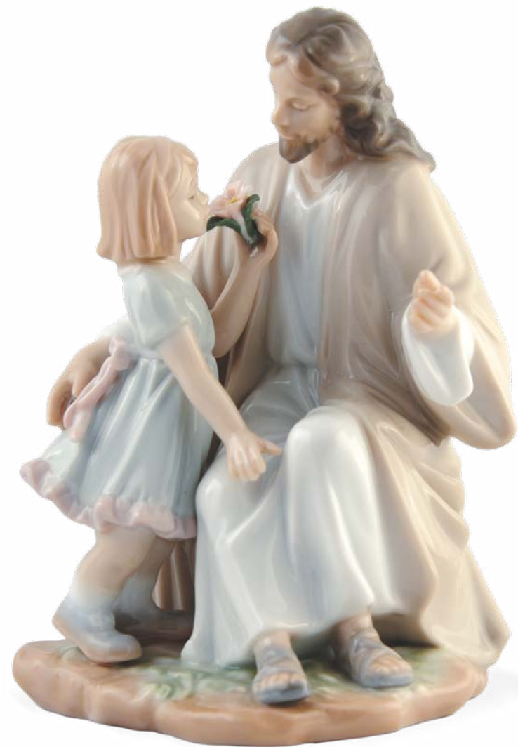
D7227 H cm 15