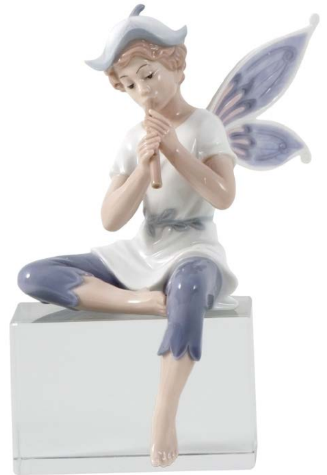
D7437 H cm 15 - Porcellana Base cristallo cm 5x5x8 inclusa