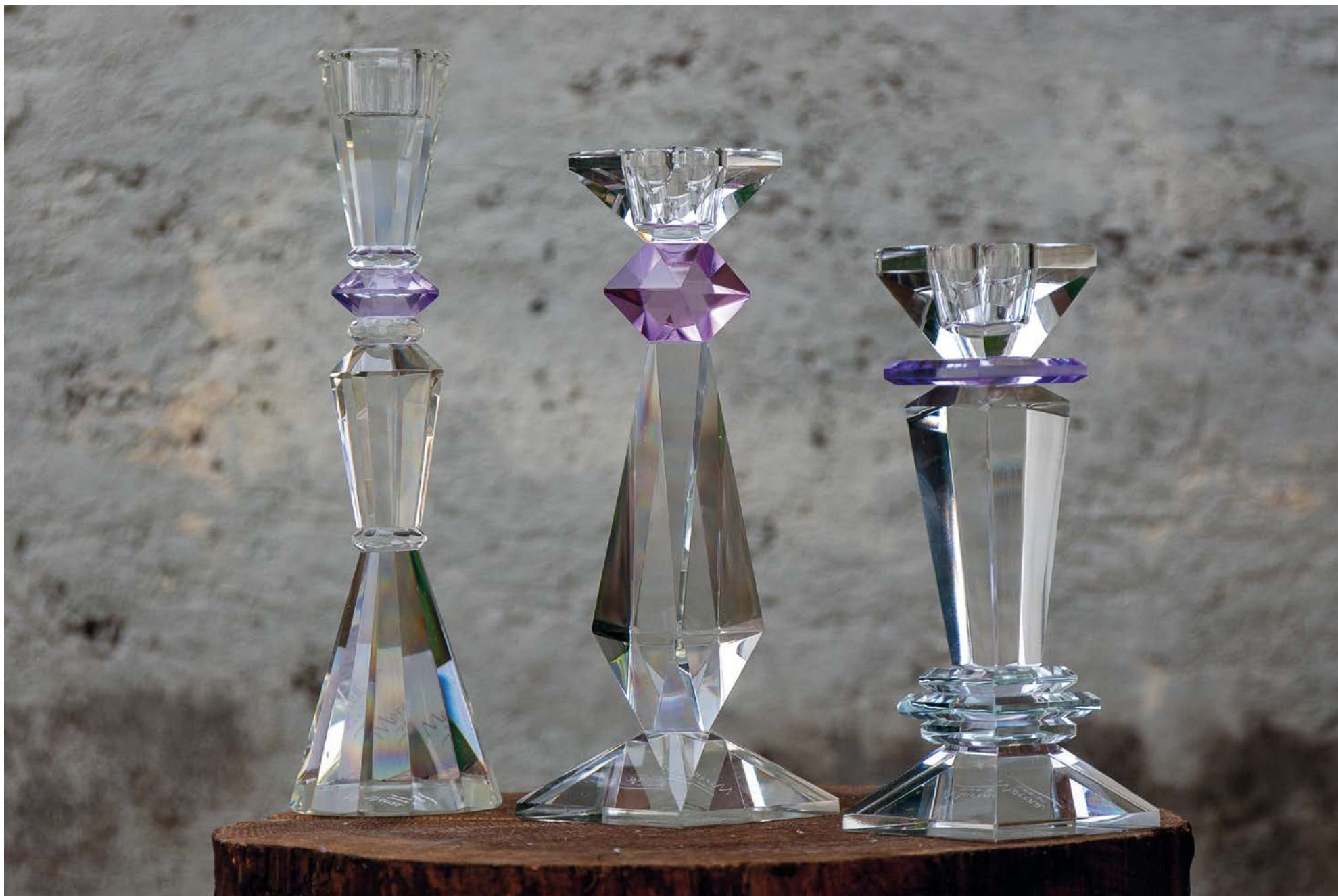
D8471 | NOVITÀ Candeliere cristallo cm 25 H