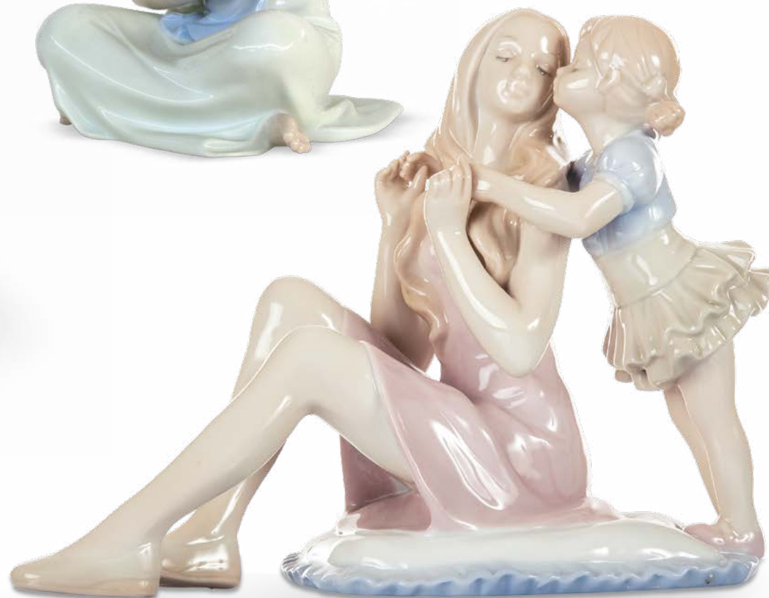
D7740 H cm 15