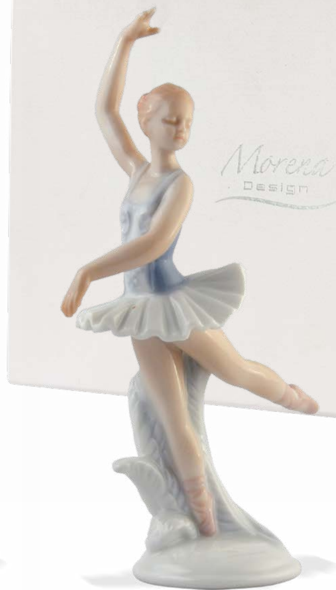
D7135 H cm 16,5