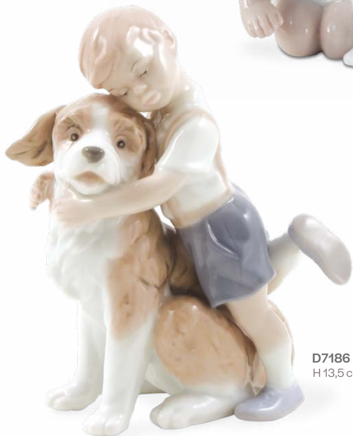
D7186 H 13,5 cm