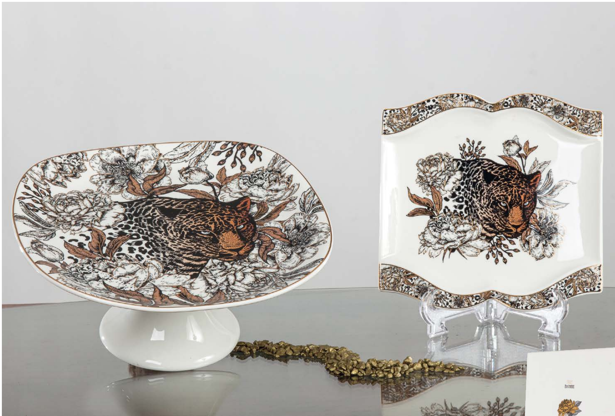
D8459 | NOVITÀ