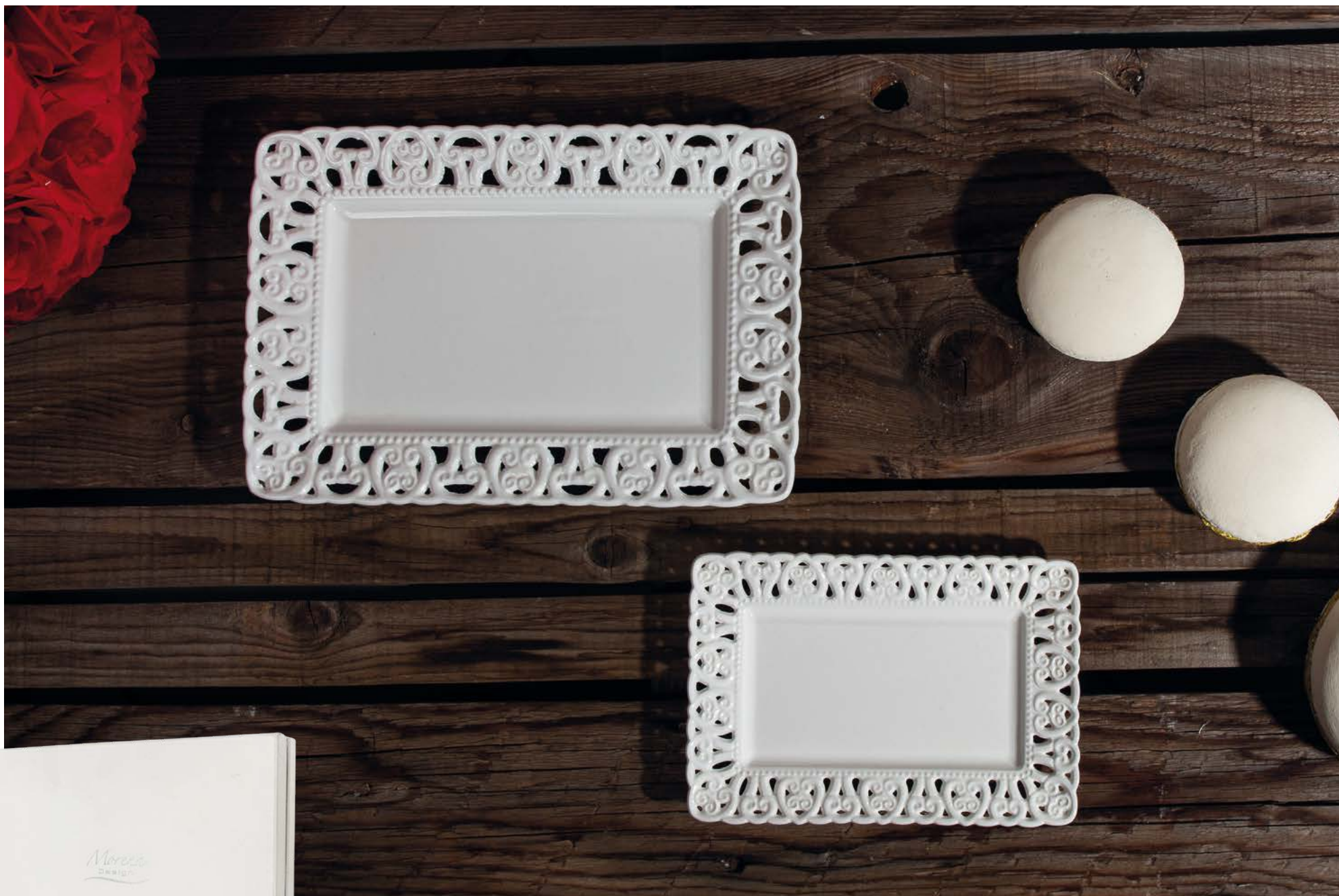
D8275 | NOVITÀ Vassoio traforato cm 30x20