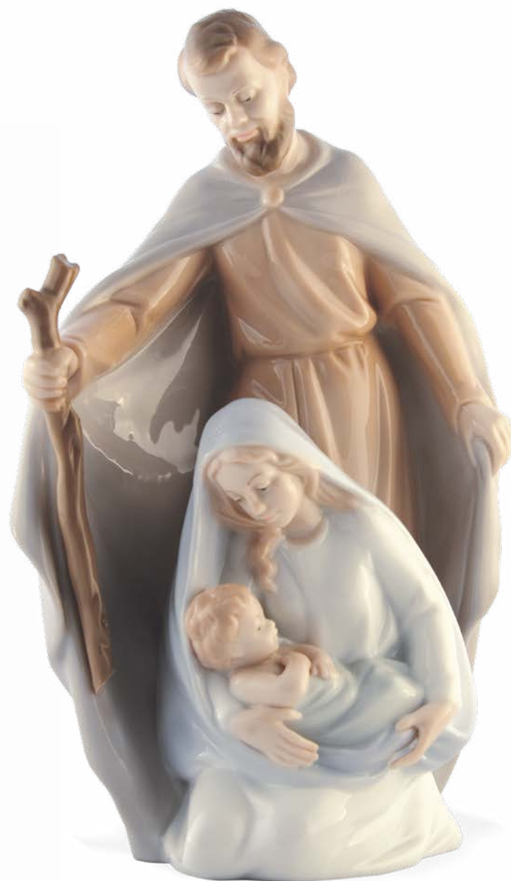
D7150 H cm 20