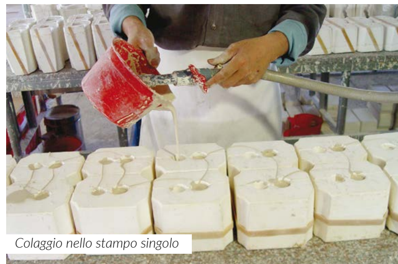
Colaggio nello stampo singolo