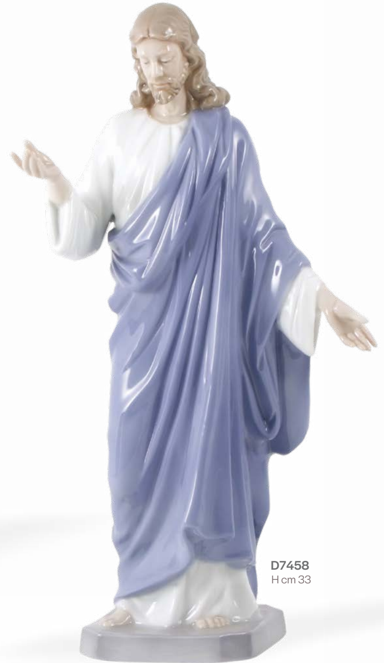
D7458 H cm 33