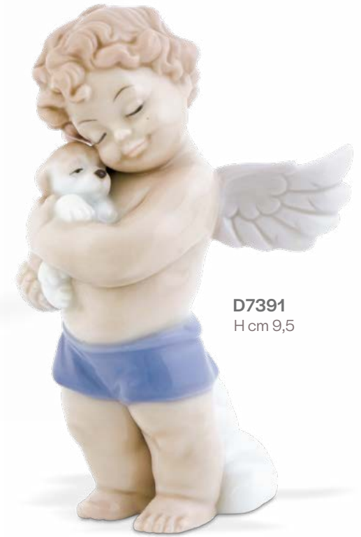
D7391 H cm 9,5