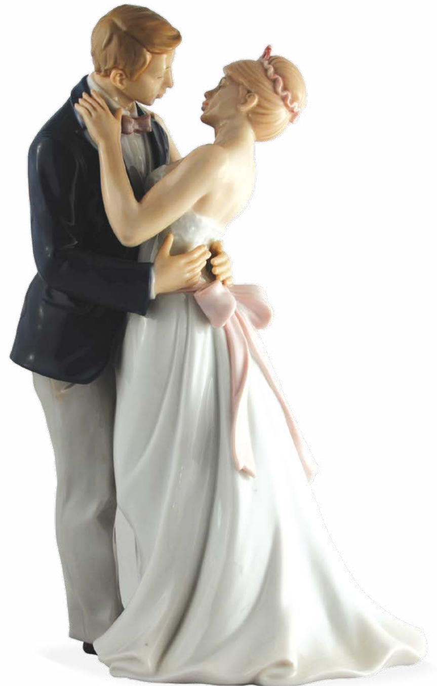
D7323 H cm 30