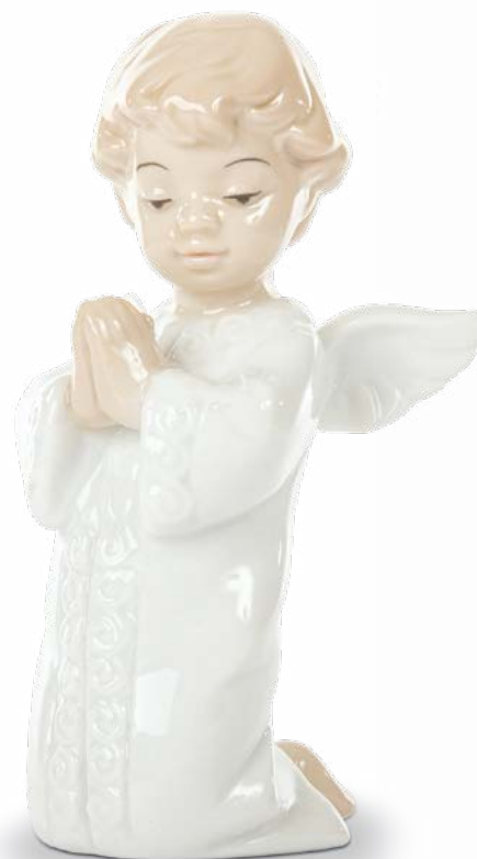
D8301 Angelo cm 10 H