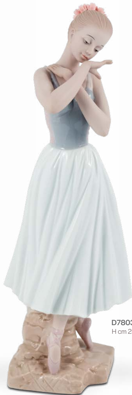
D7803 H cm 25