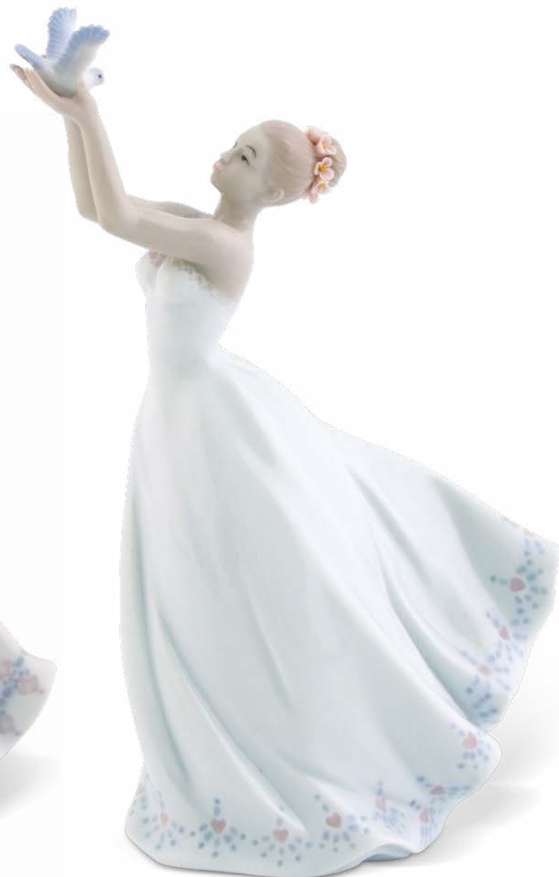
D7394 cm 24