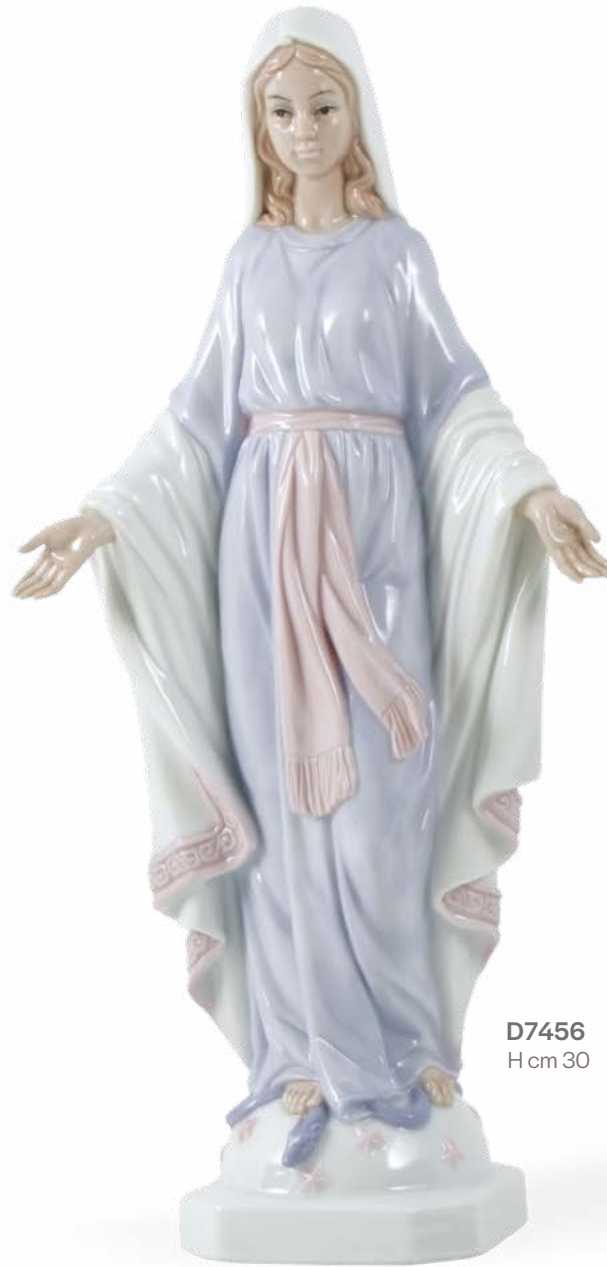
D7456 H cm 30