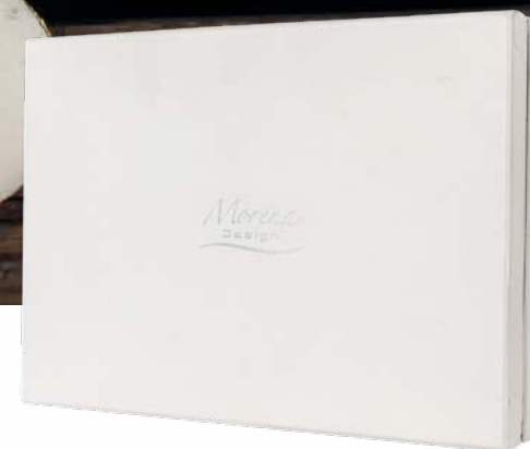
D8264 Vassoio cm 35x23