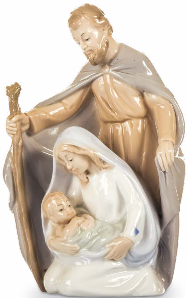
D7744 H cm 15