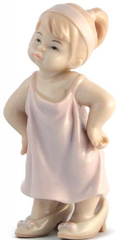
D7251 H cm 10