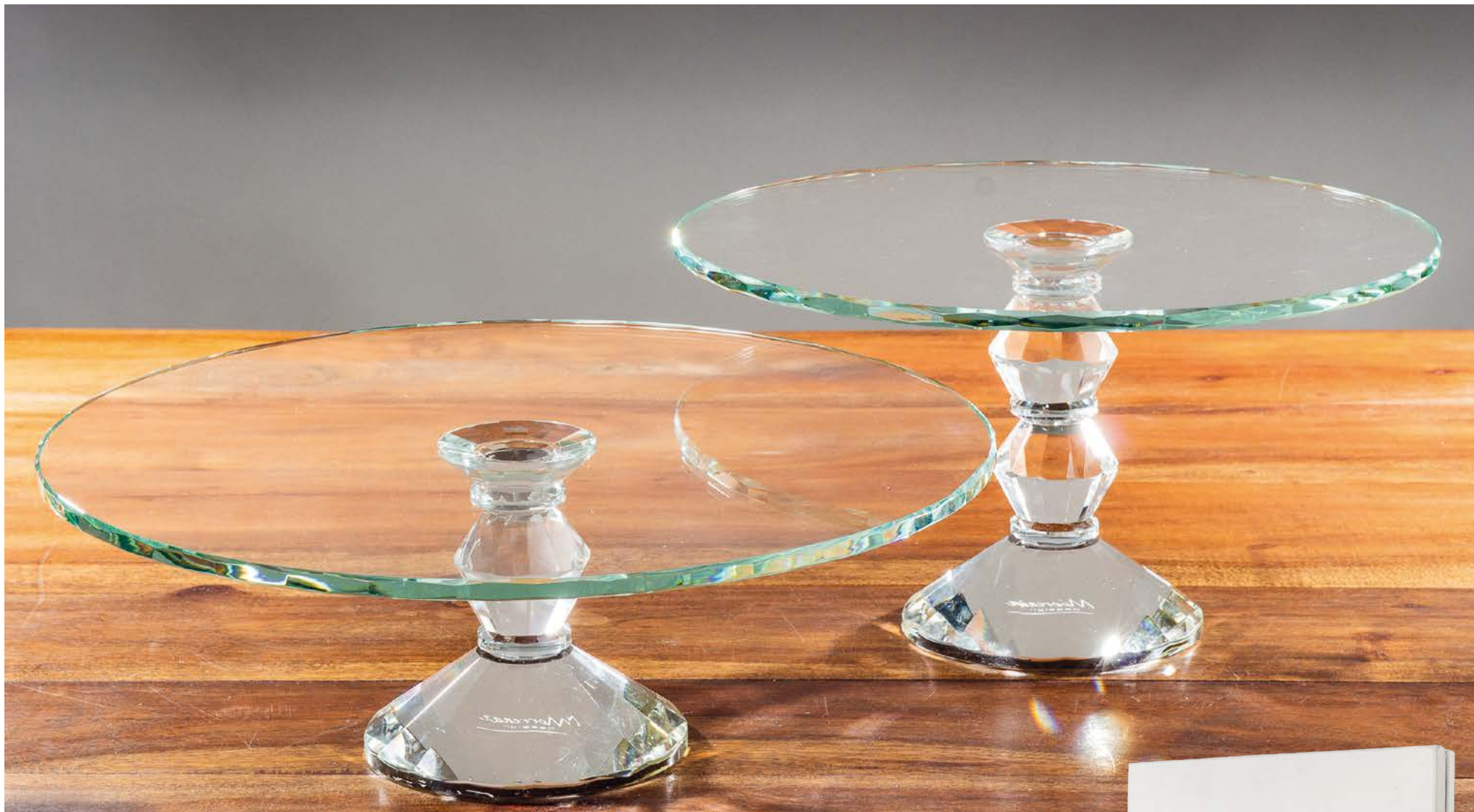
D8126 Alzata cristallo cm ø 35x12 H