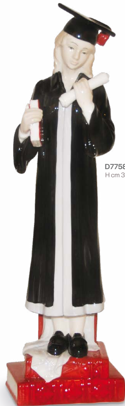
D7758 H cm 30