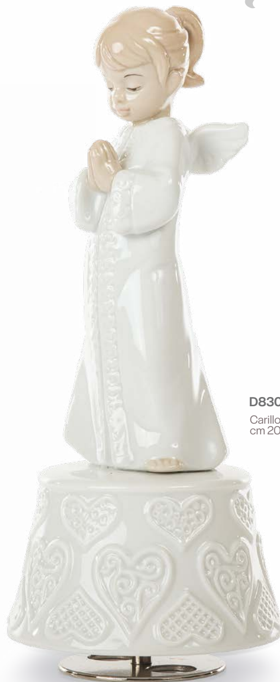
D8306 Carillon cm 20 H