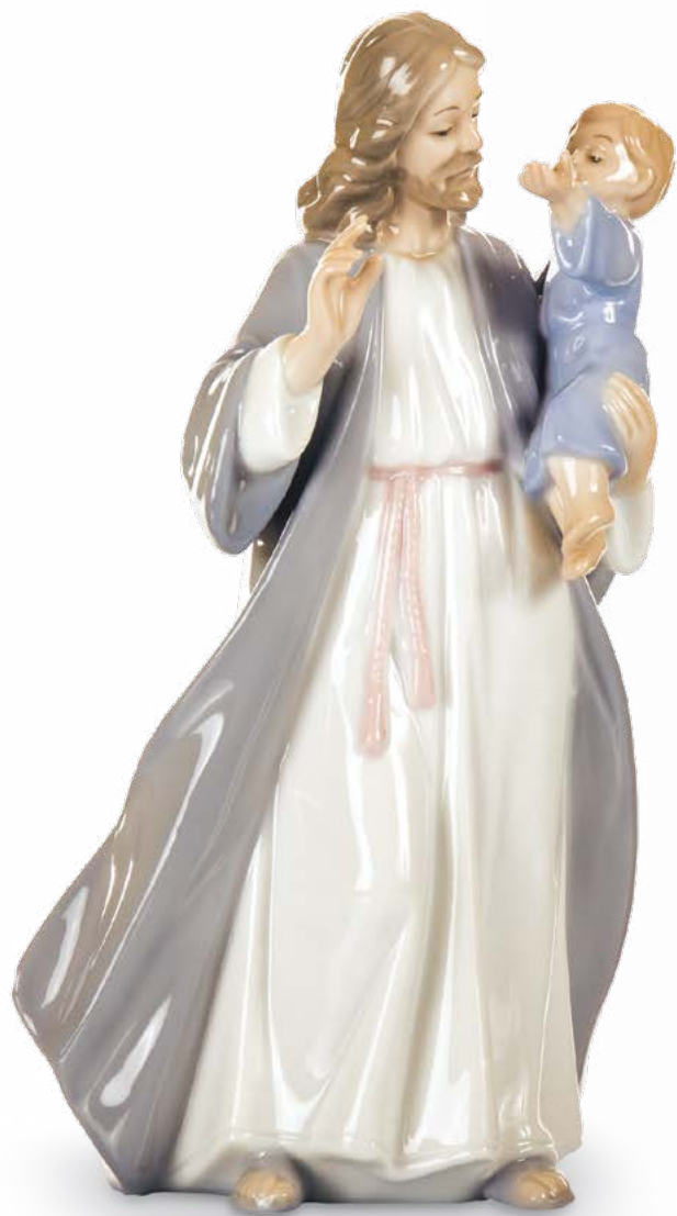
D7742 H cm 15