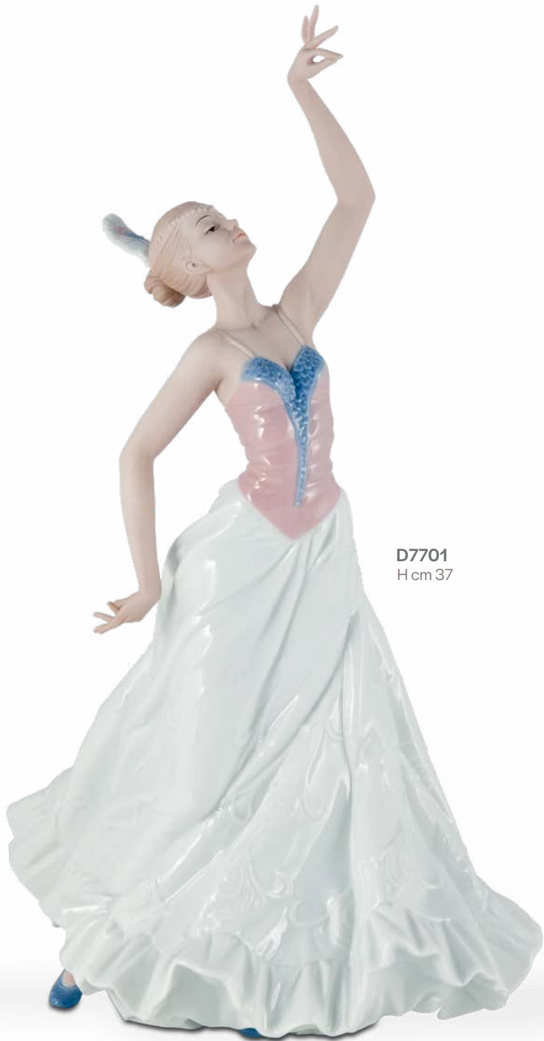
D7701 H cm 37