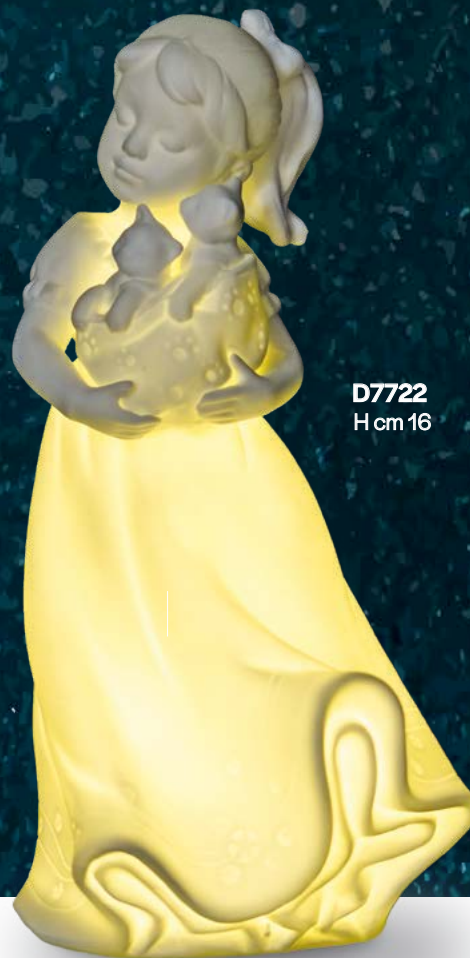
D7722 H cm 16