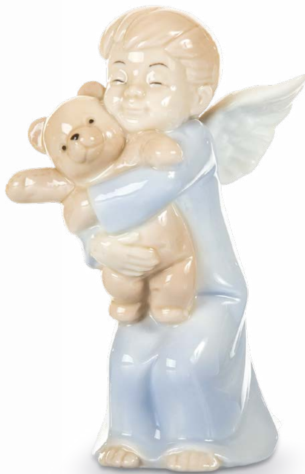
D7712 H cm 12