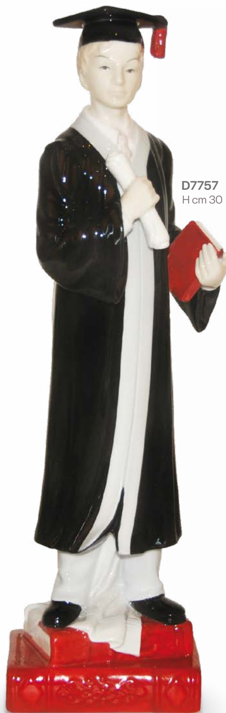
D7757 H cm 30