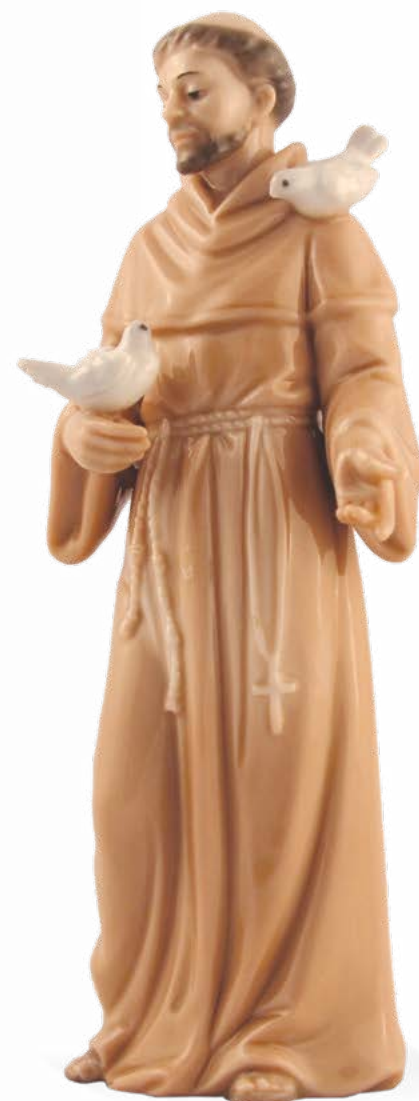
D7295 H cm 15