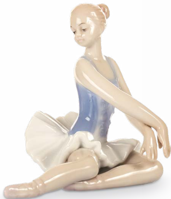
D7746 cm 10 - H cm 8