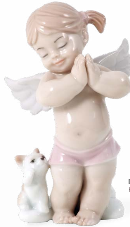
D7432 H cm 10