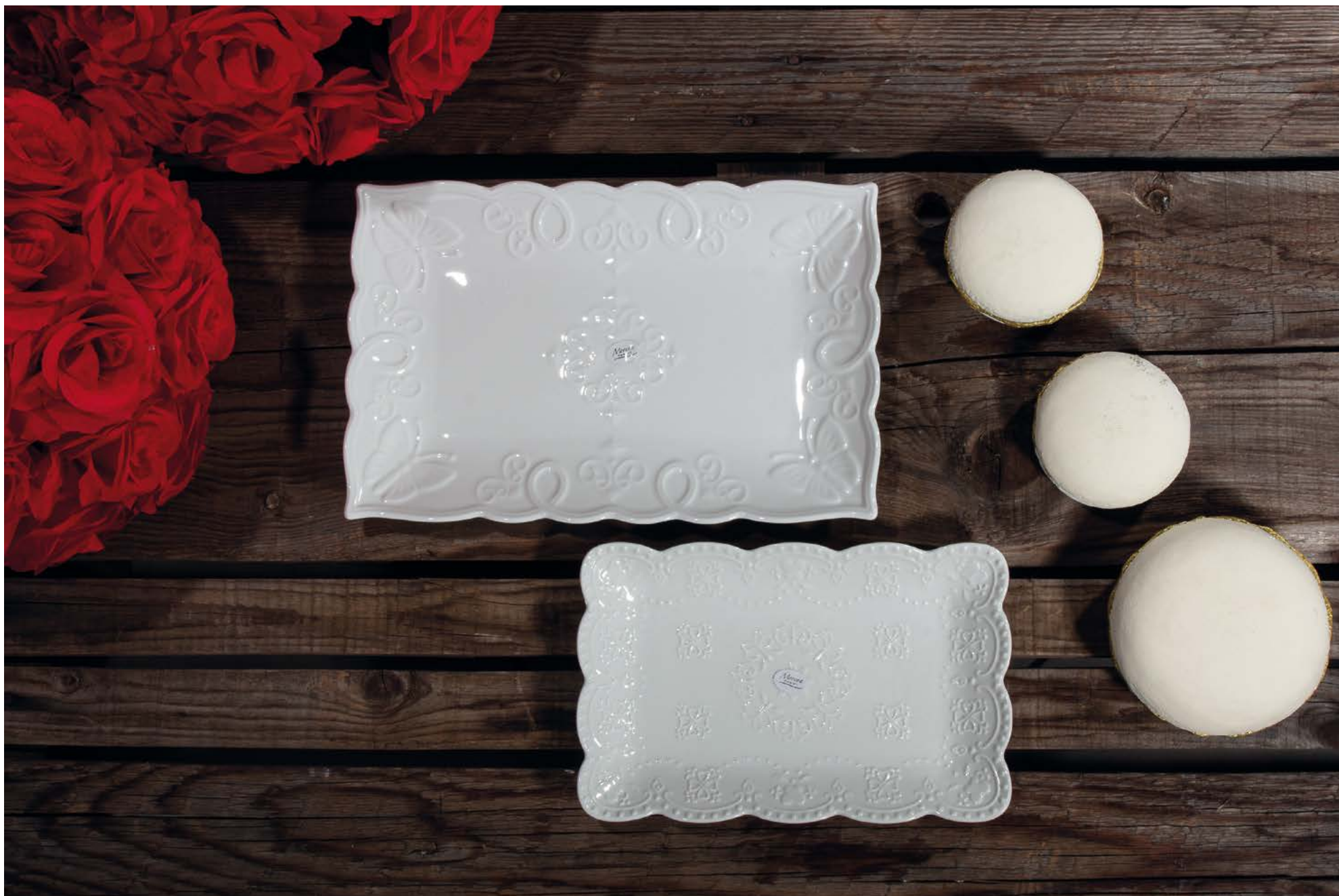
D8237 Vassoio cm 31x20