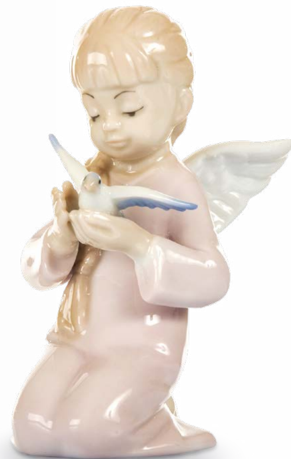
D7711 H cm 12